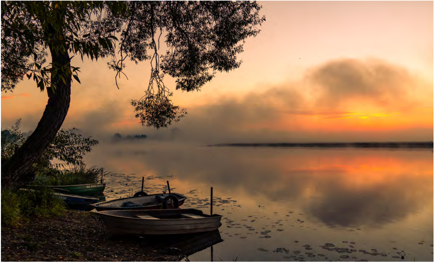
15. Brama piekła