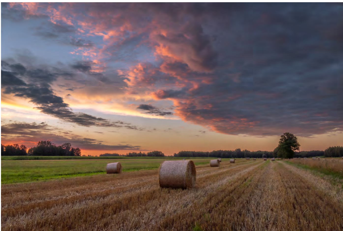
27. Po żniwach