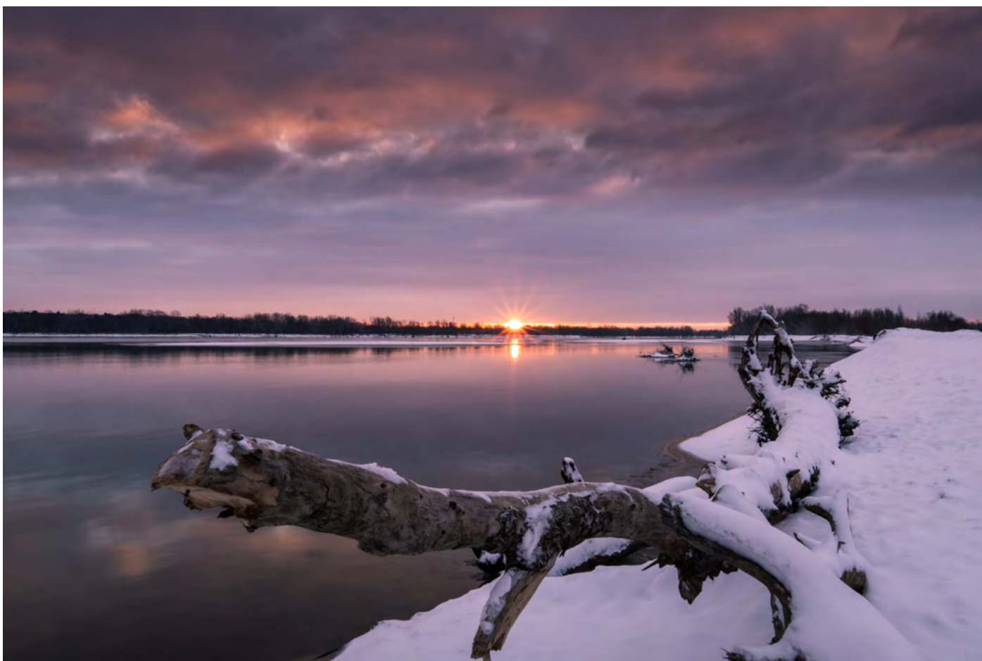
37. Dzień dobry Wiśło