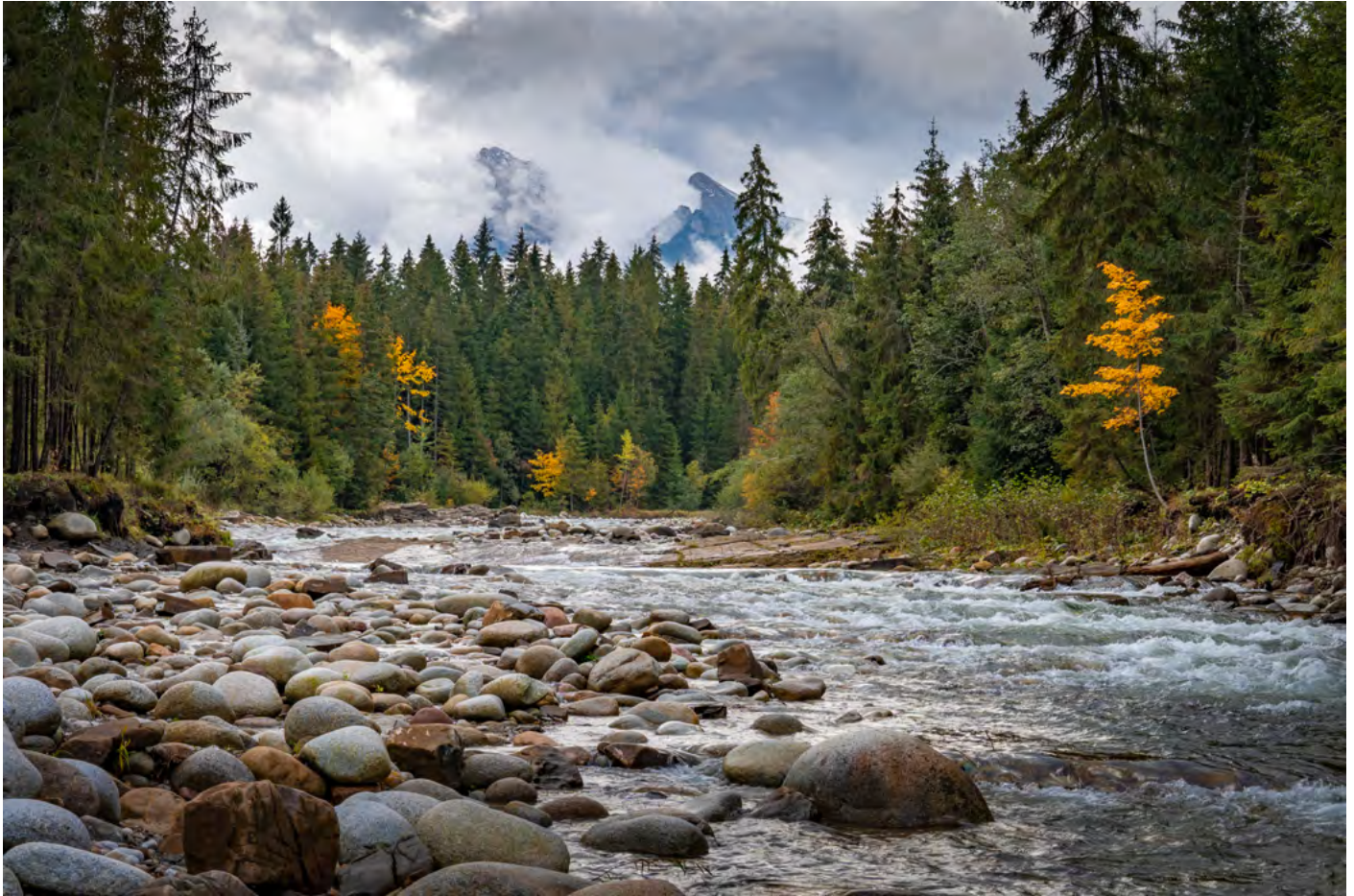
33. Na zakręcie