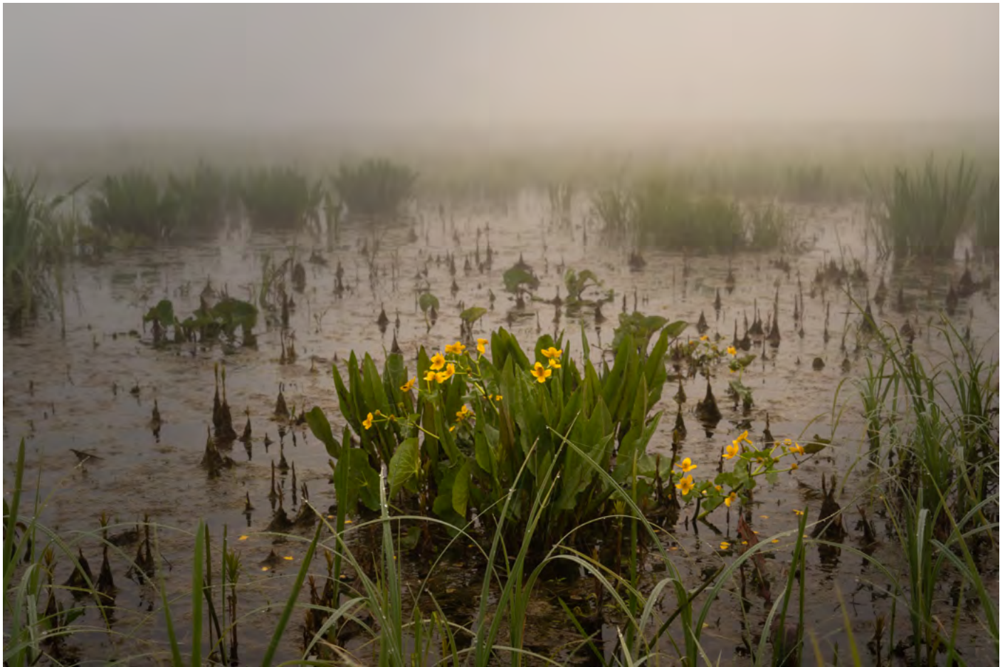
49. Mocarowe piękności