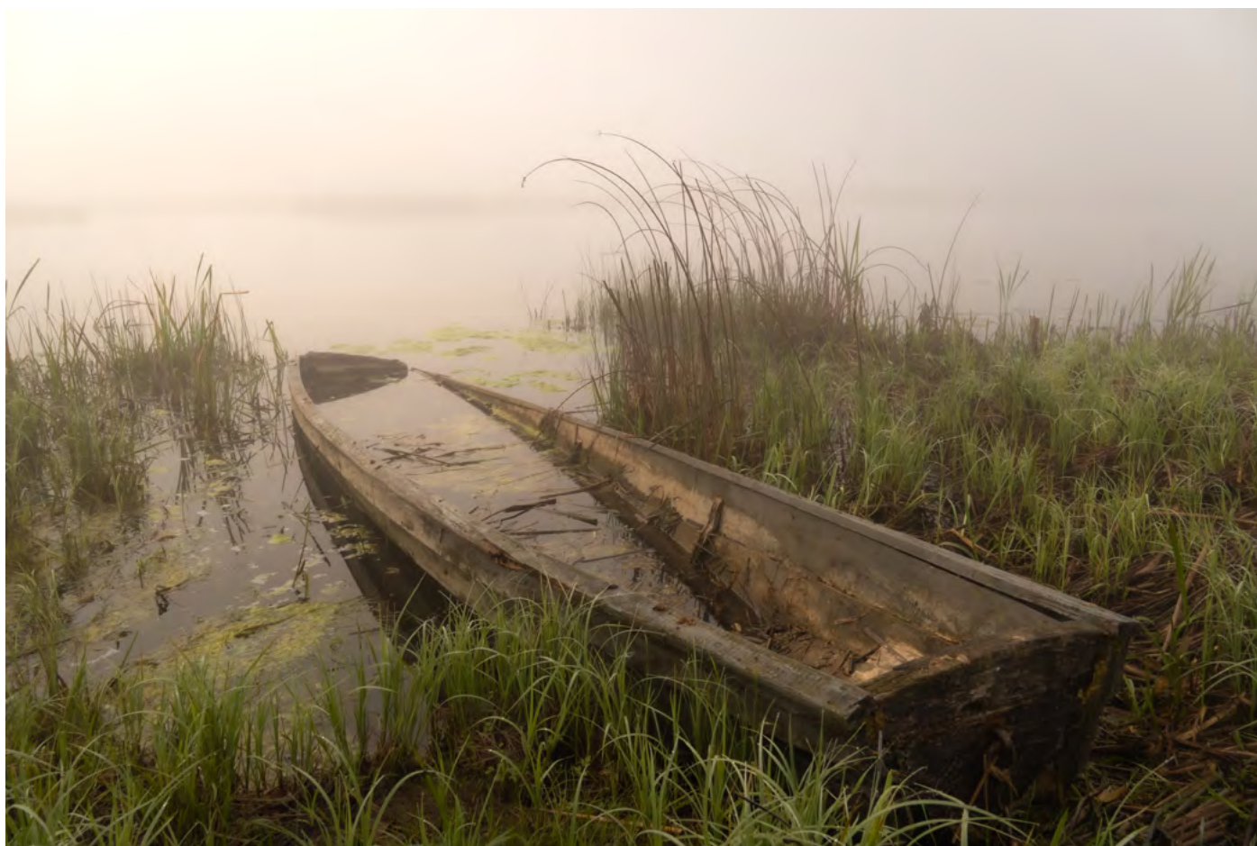
48. Już nie popłynę