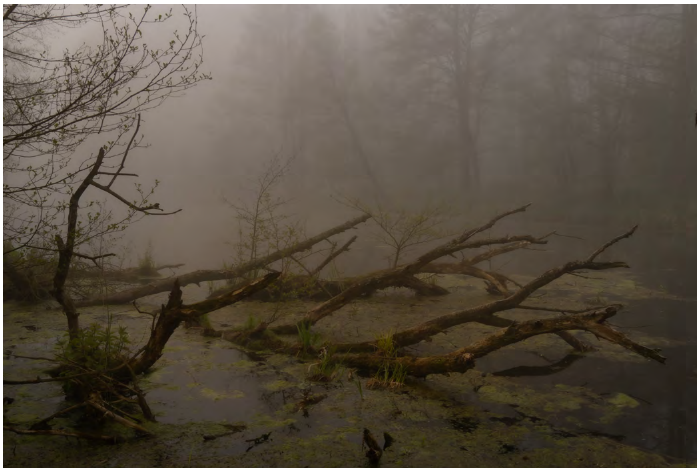
46. Straszno wszędzie