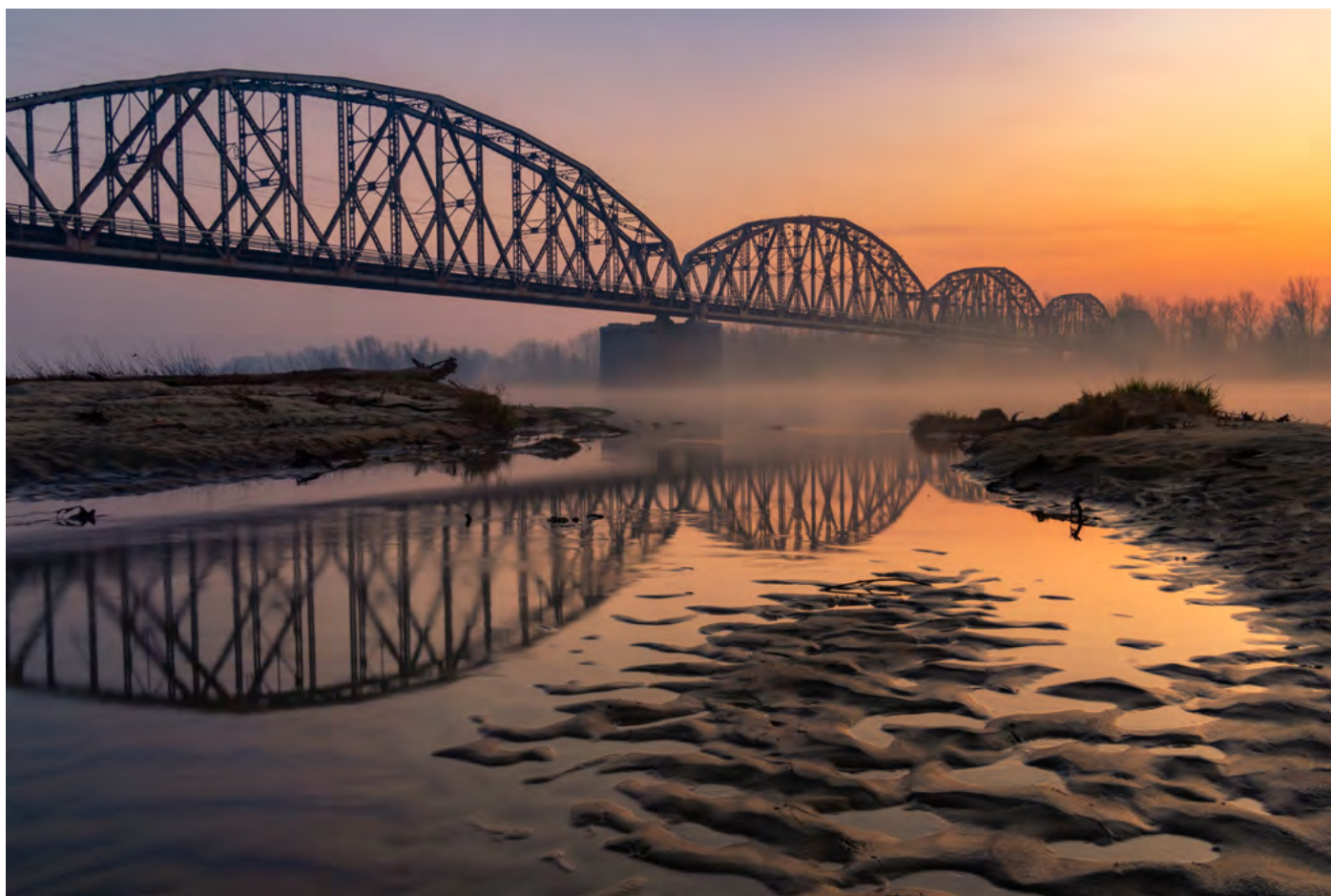
18. Most do krainy szczęścia