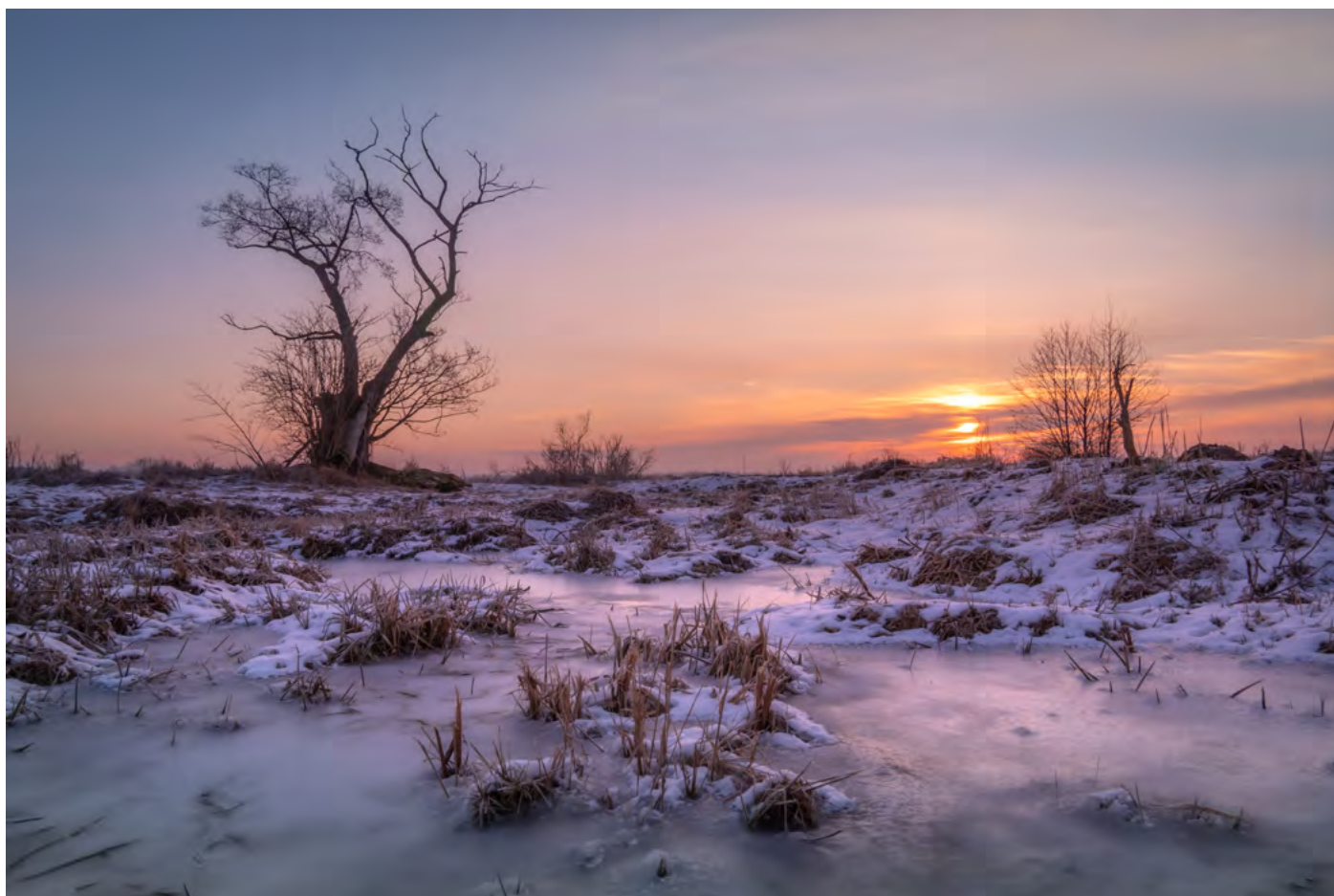
38. Zimowa bajka