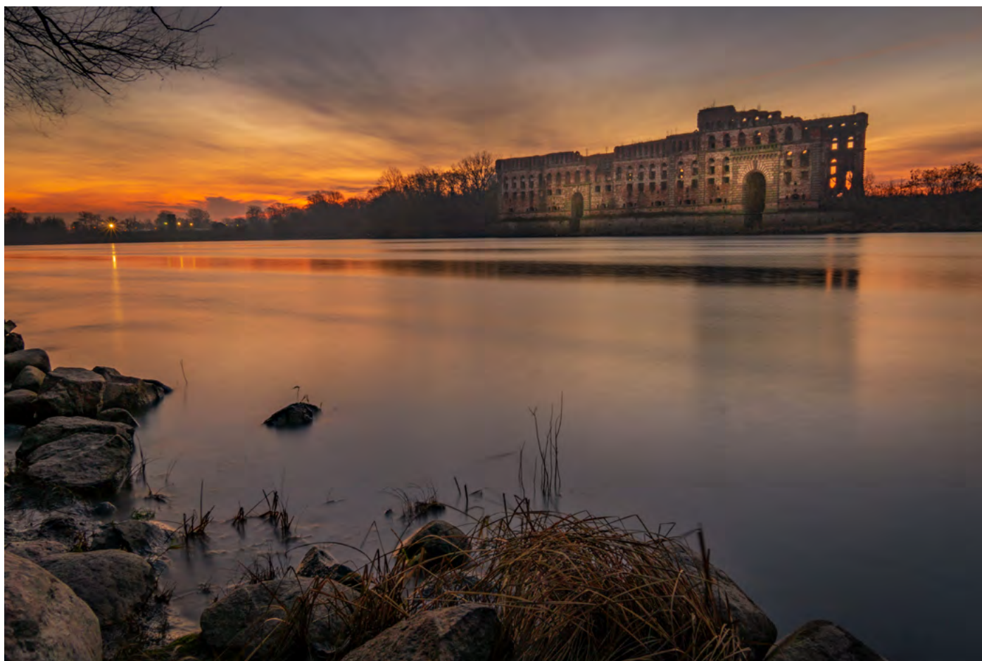
24. Śnię o dawnej świetności