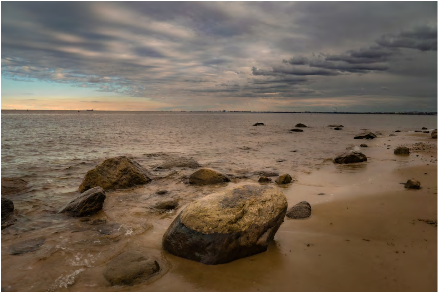
43. W siną dal