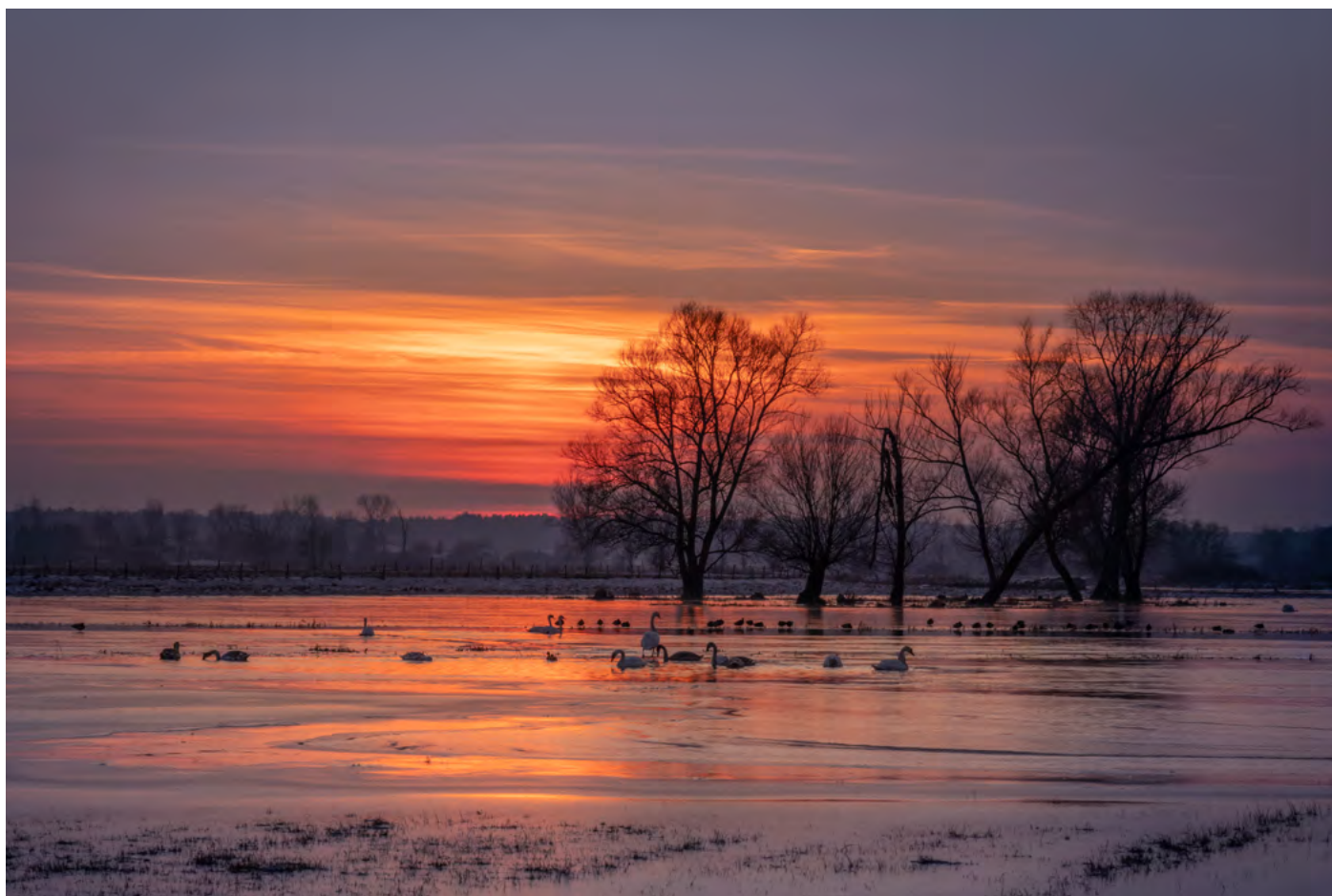
40. Zimno nam