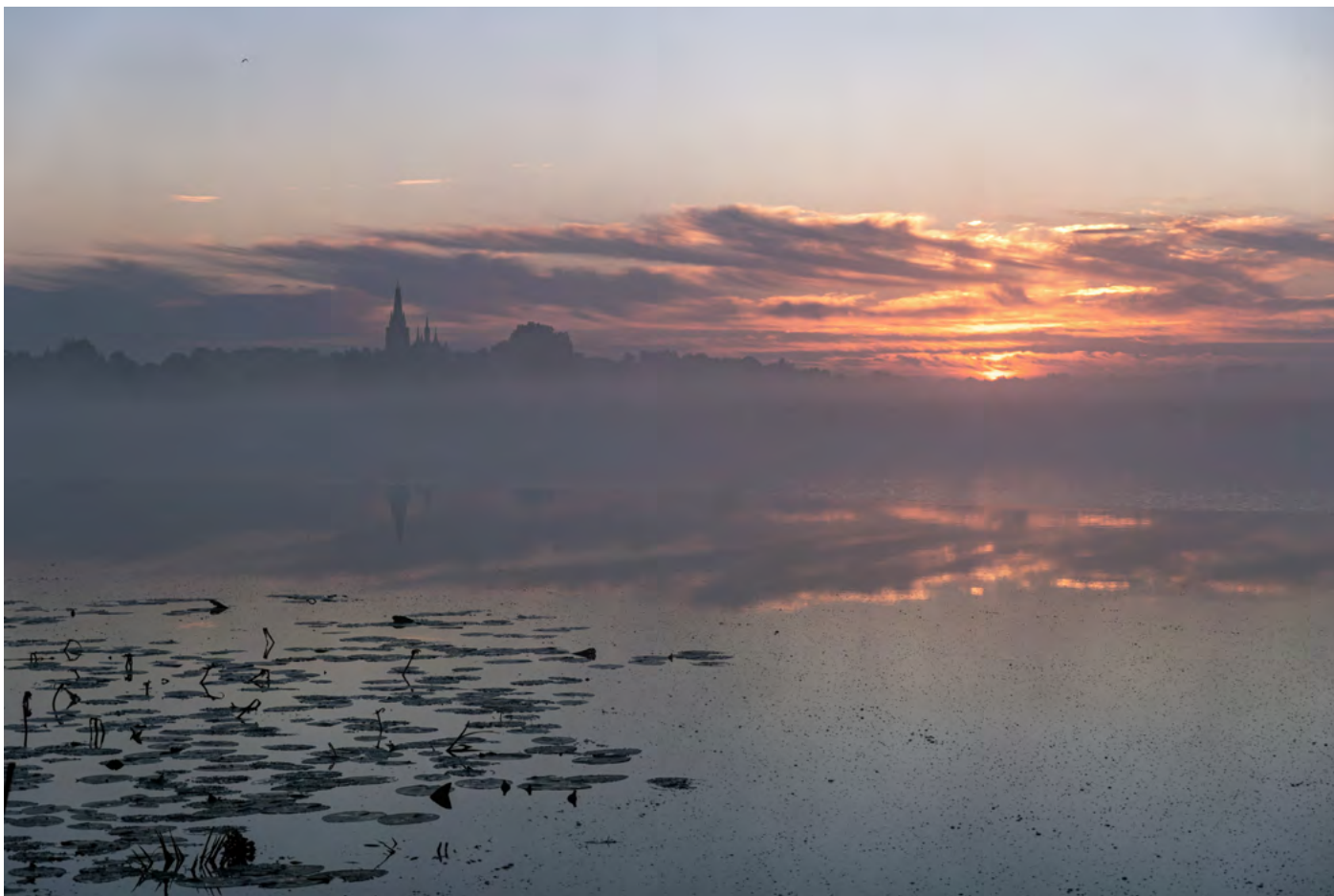
3. Senne majaki