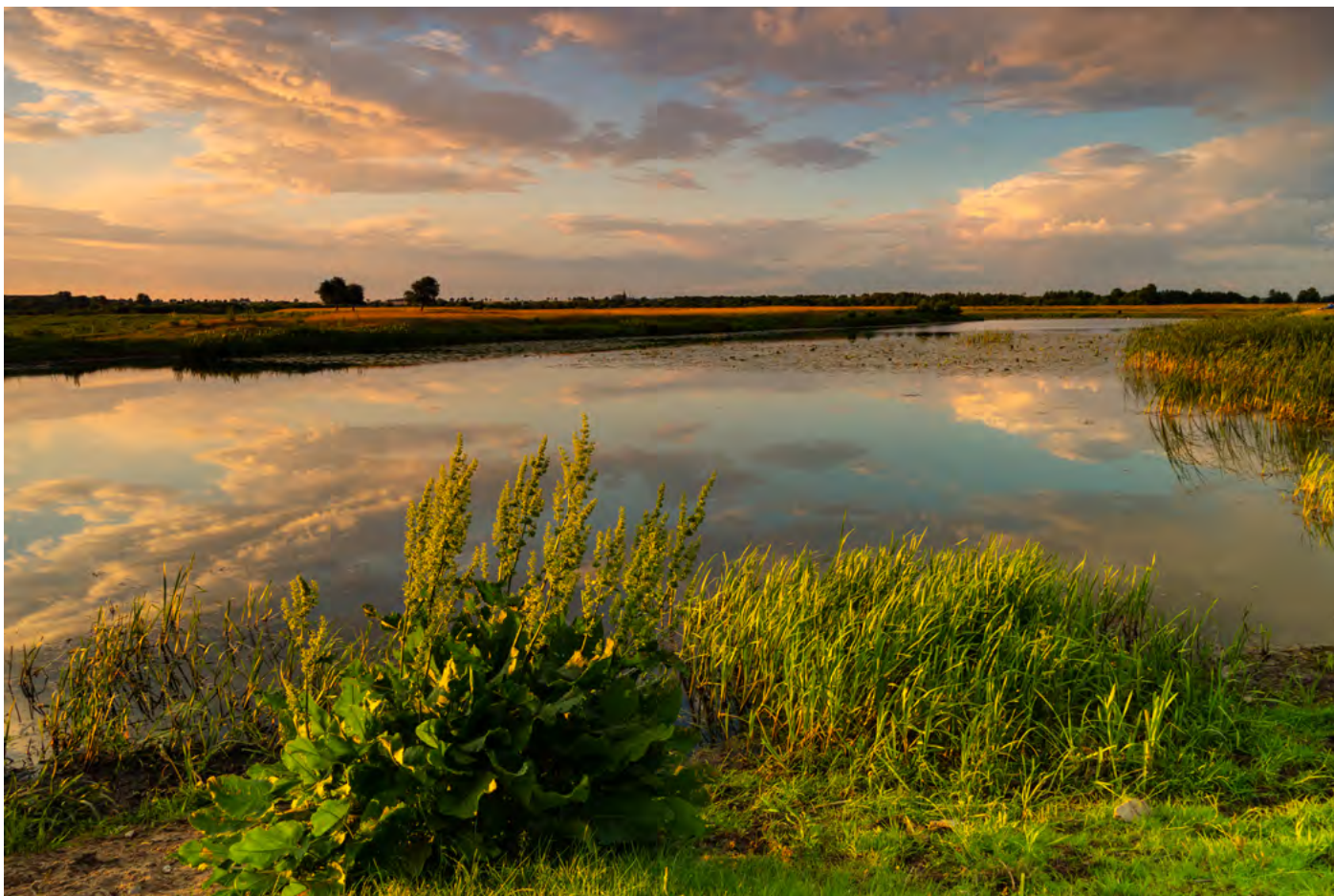
7. Słodkiego, miłego życia