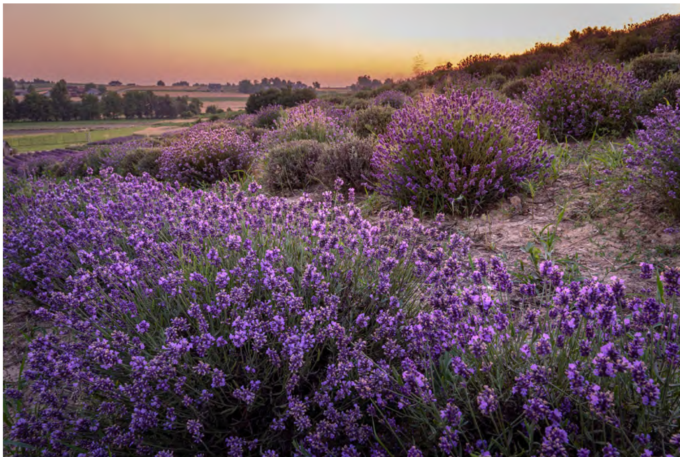
36. Fioletowy zawrót głowy