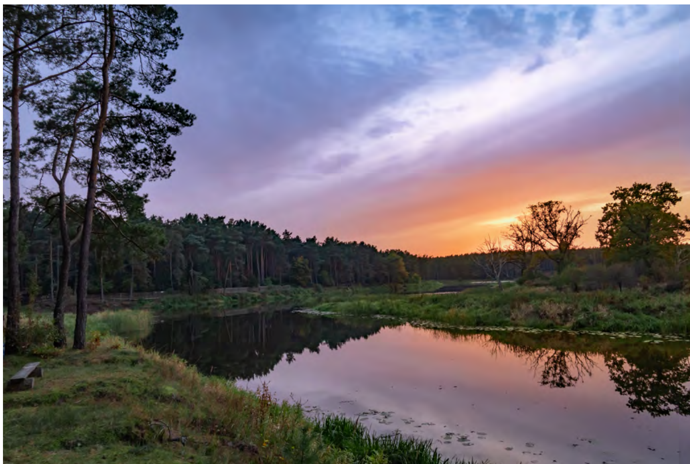
26. Siła spokoju