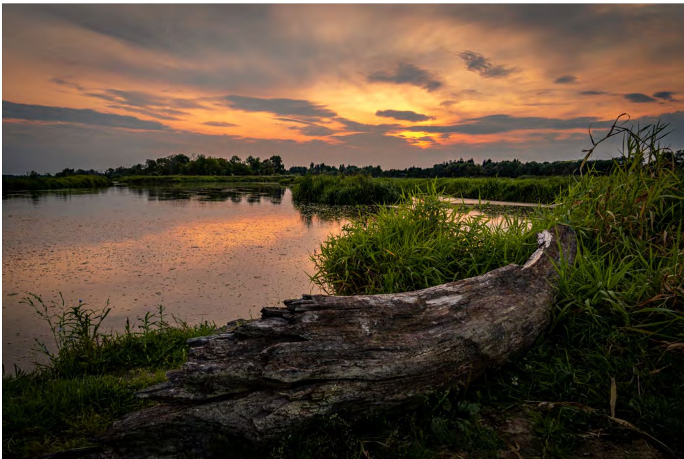
35. Z prądem