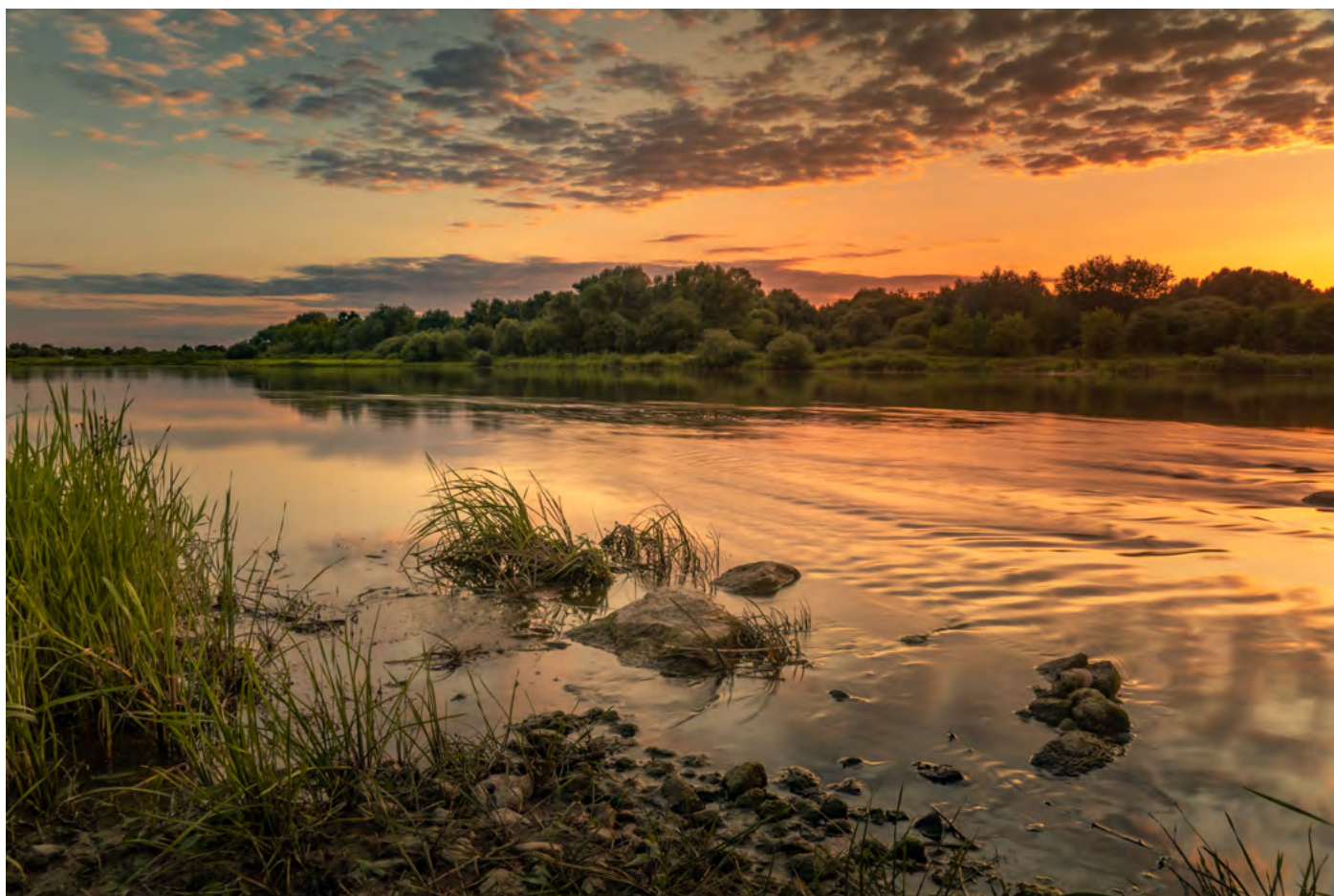
14. Letni spokój