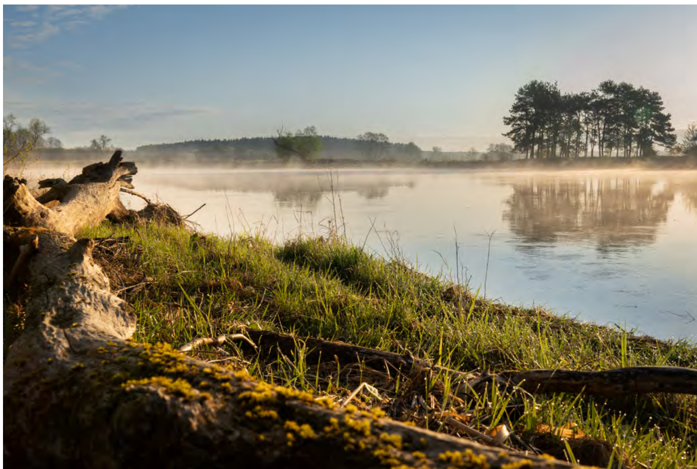
44. Bug z nami