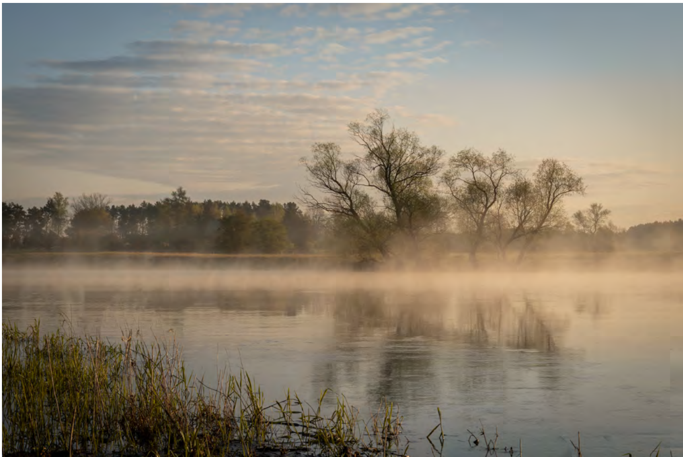
45. We mgle