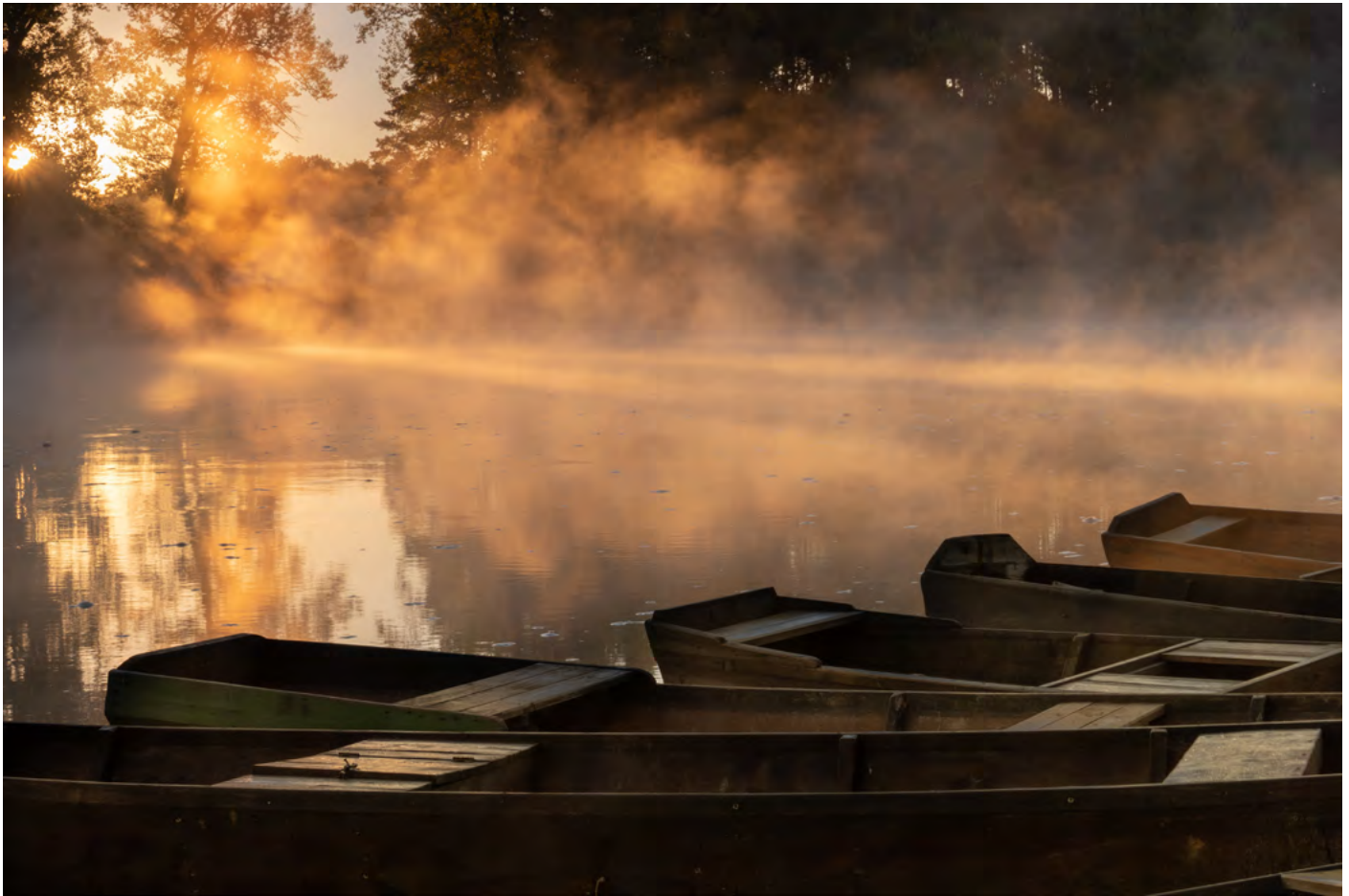
23. Świetliste przedstawienie