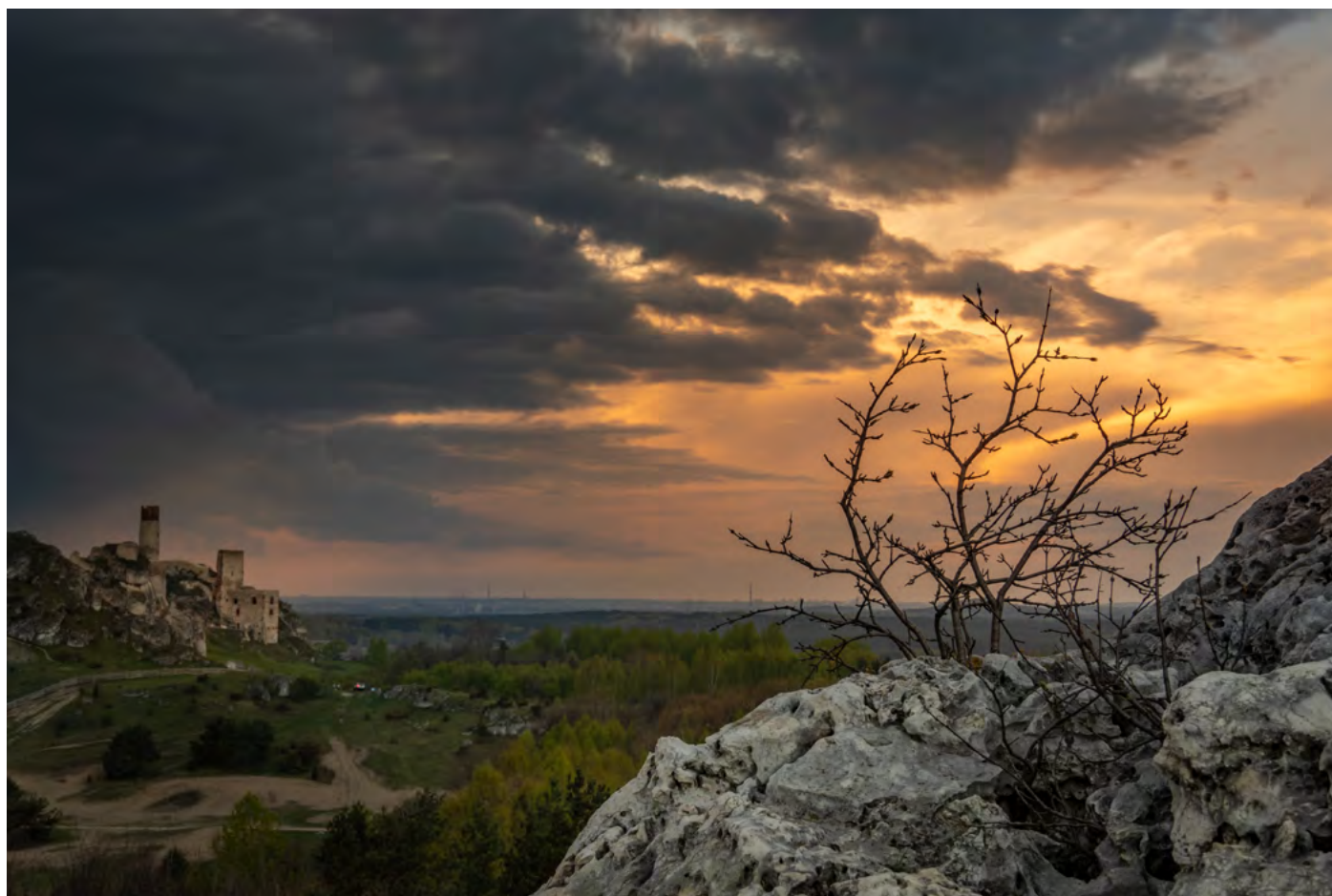
10. Nadciaga groza