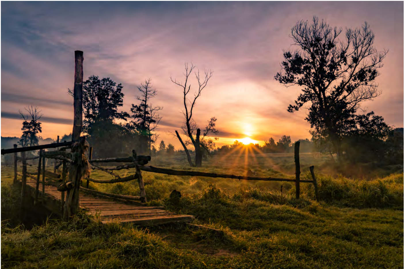
13. Krowia przeprawa