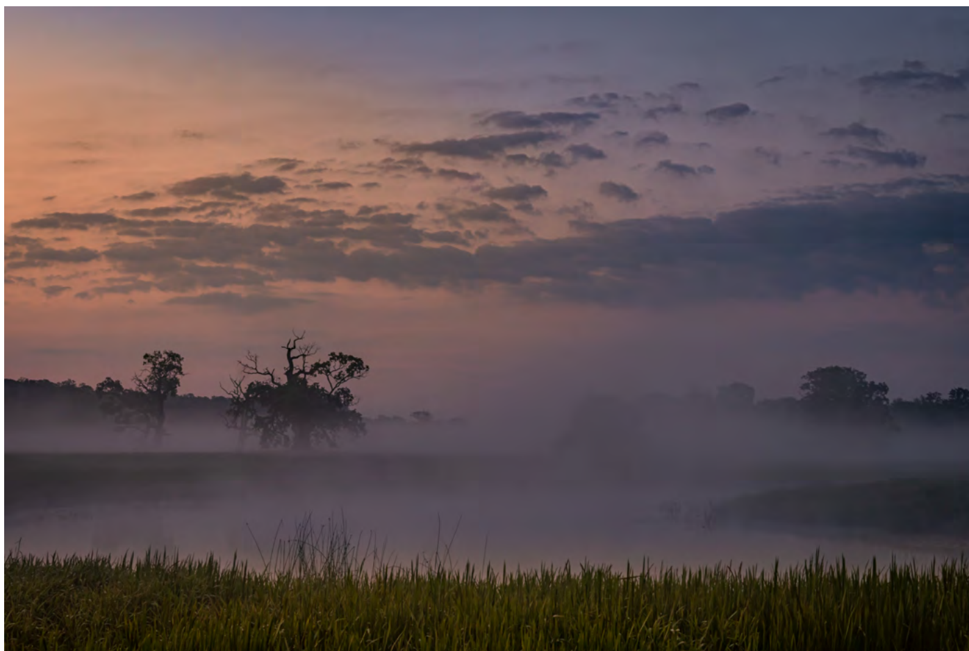
2. Na granicy