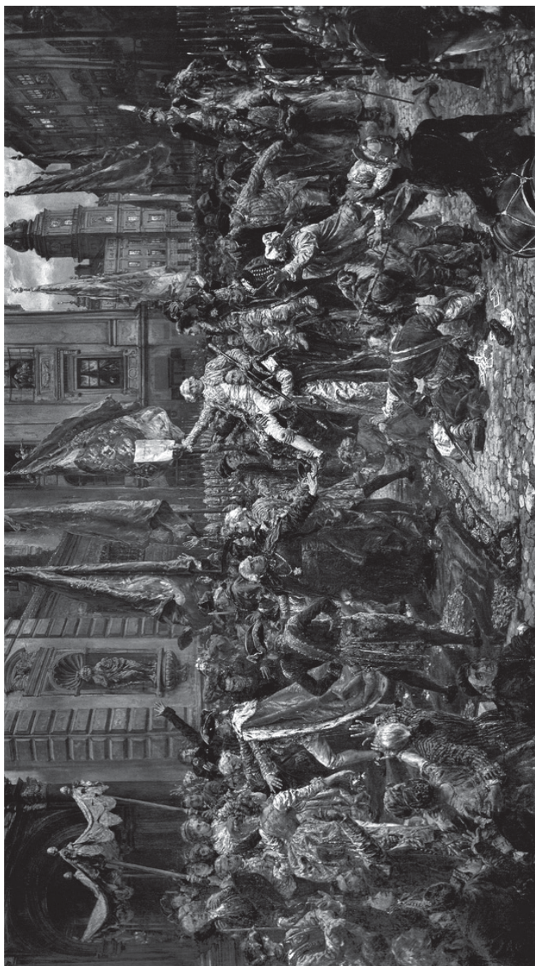
Uchwalenie Konstytucji 3 Maja, Jan Matejko, 1891