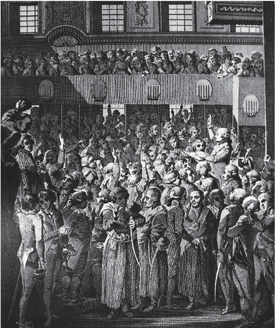
Kołacz królewski – alegoria pierwszego rozbioru Polski (Noël Le Mire/domena publiczna)

jącej, sejm rozbiorowy powołał do życia Komisję Edukacji Narodowej i Szkołę Rycerską, instytucje, które w przyszłości odegrały ważną rolę w próbie odnowy i ratowania Rzeczypospolitej. Zaan-