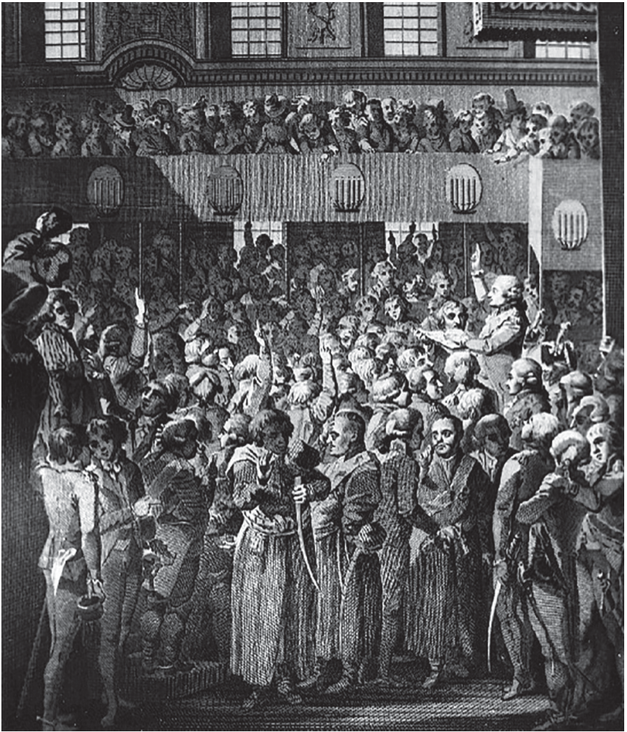
Alegoria Konstytucji 3 Maja 1791 r., rycina Daniela Mikołaja Chodowieckiego z 1792 r.; Biblioteka Narodowa

strzygnięcie swojej sprawy w sądzie. Konstytucja wyznaczała kierunek zmian prawnych, których efektem miała być pełna wolność najliczniejszej warstwy społecznej. Formalnie nie zniosła obowiązującej od XVI wieku zasady przywiązania do ziemi, ale tworzy-