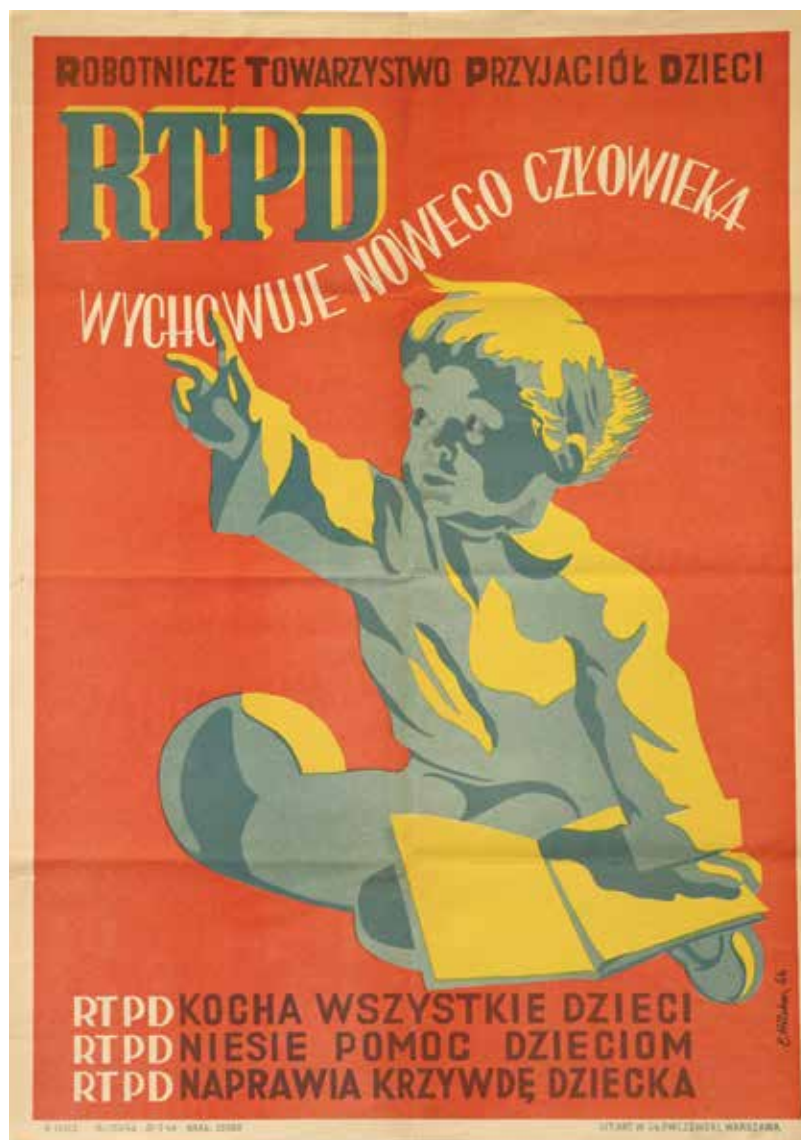
Kat. 13. E. Hilchen, RTPD wychowuje nowego człowieka