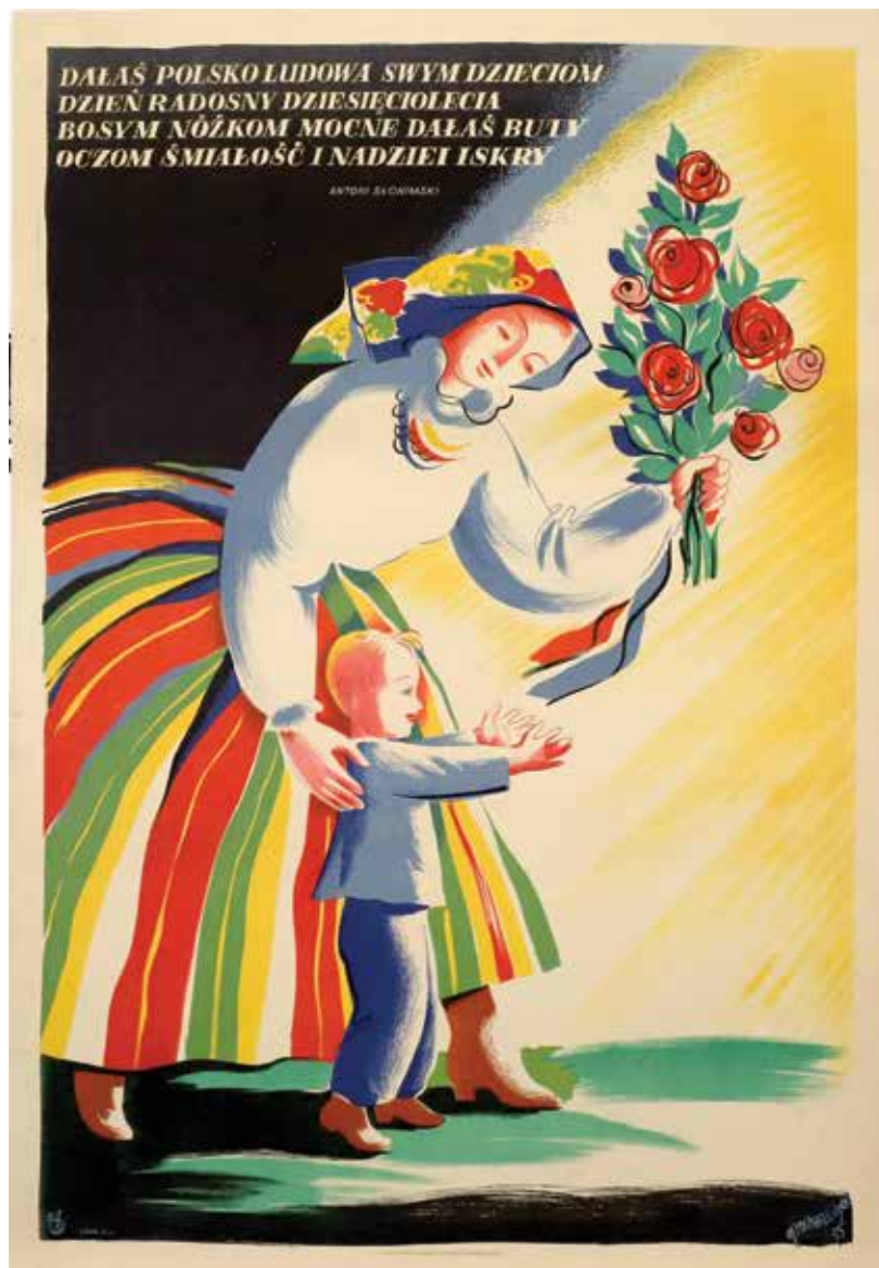
Il. 6. Tadeusz Gronowski, Dałaś Polsko Ludowa swym dzieciom dzień radosny...