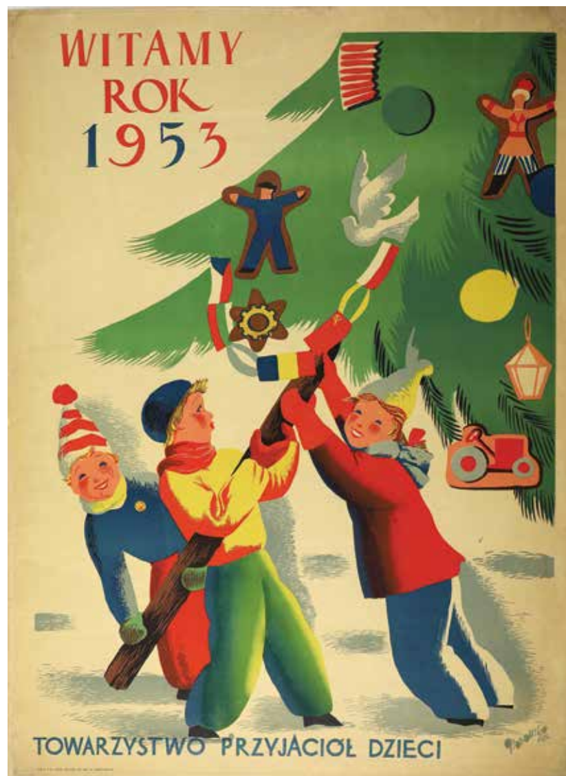
Kat. 15. T. Gronowski, Witamy rok 1953. Towarzystwo Przyjaciół Dzieci