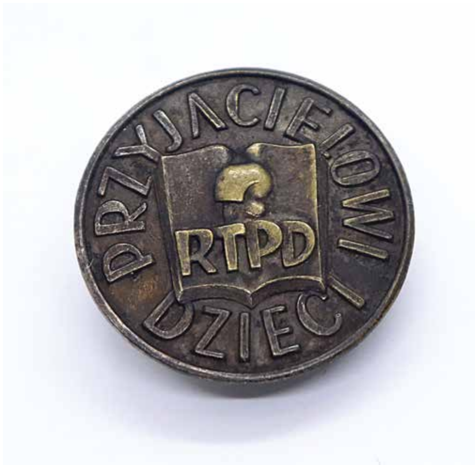
Kat. 18. Znaczek Przyjacielowi Dzieci