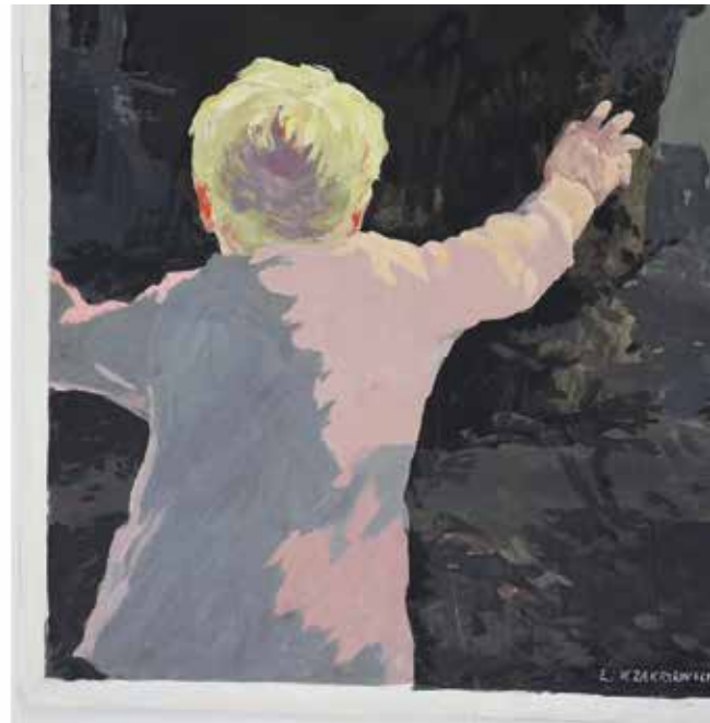
Fragment projektu plakatu nr inw. PI0.91 przed i po konserwacji.