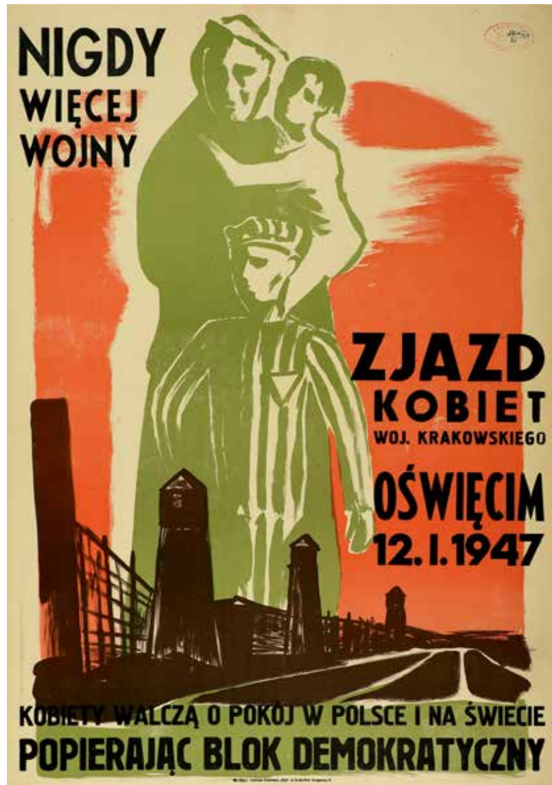
Kat. 4. Autor nieznany, Nigdy więcej wojny!