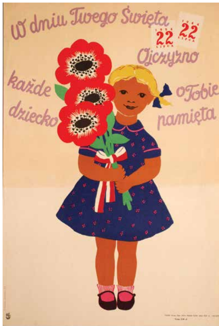
Kat. 27. A. Laurman-Waszewska, W dniu Twego święta...