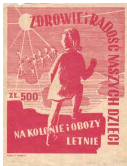
Kat. 19. Zdrowie i radość naszych dzieci – cegiełki kwestowe