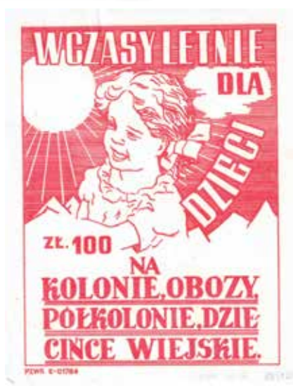
Kat. 20. Wczasy letnie dla dzieci. – cegiełki kwestowe