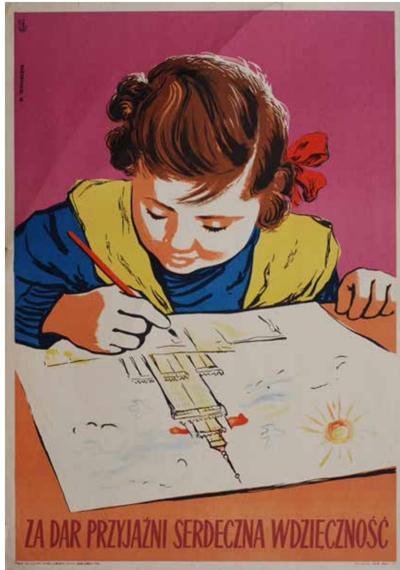
Kat. 7. M. Teodorczyk, Za dar przyjaźni serdeczna wdzięczność