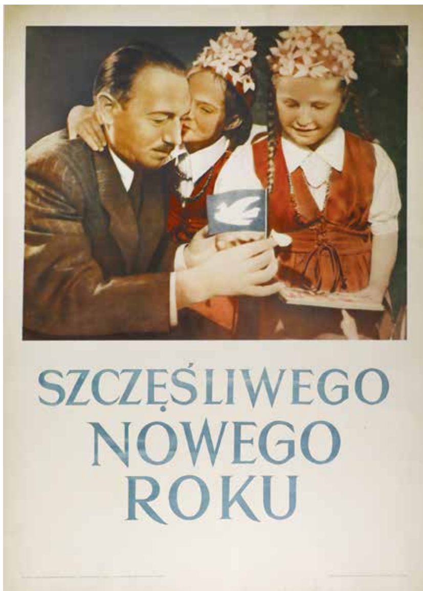
Kat. 8. Autor nieznan, Szczęśliwego Nowego Roku