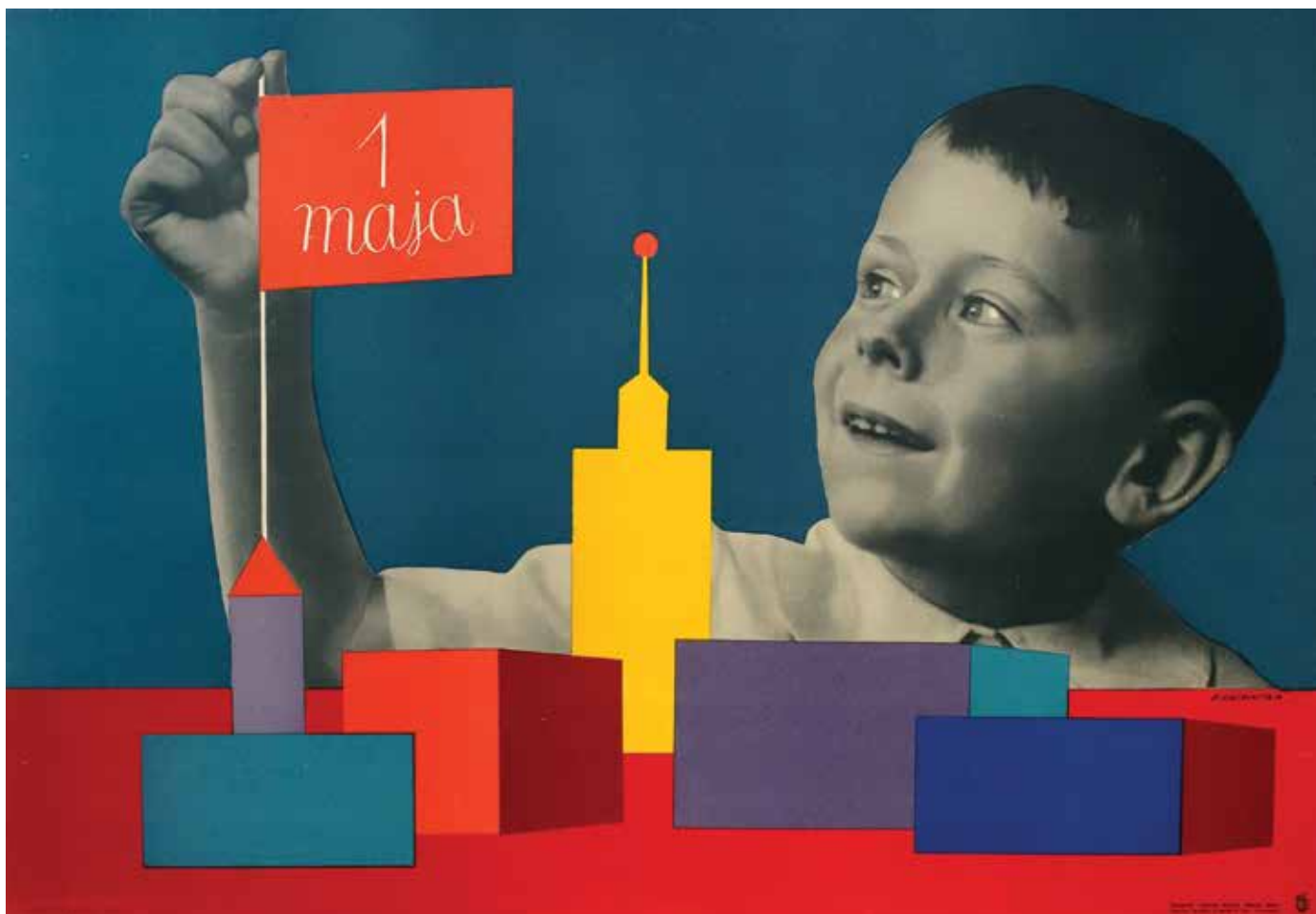
Il. 16. Roman Cieślewicz, 1 maja