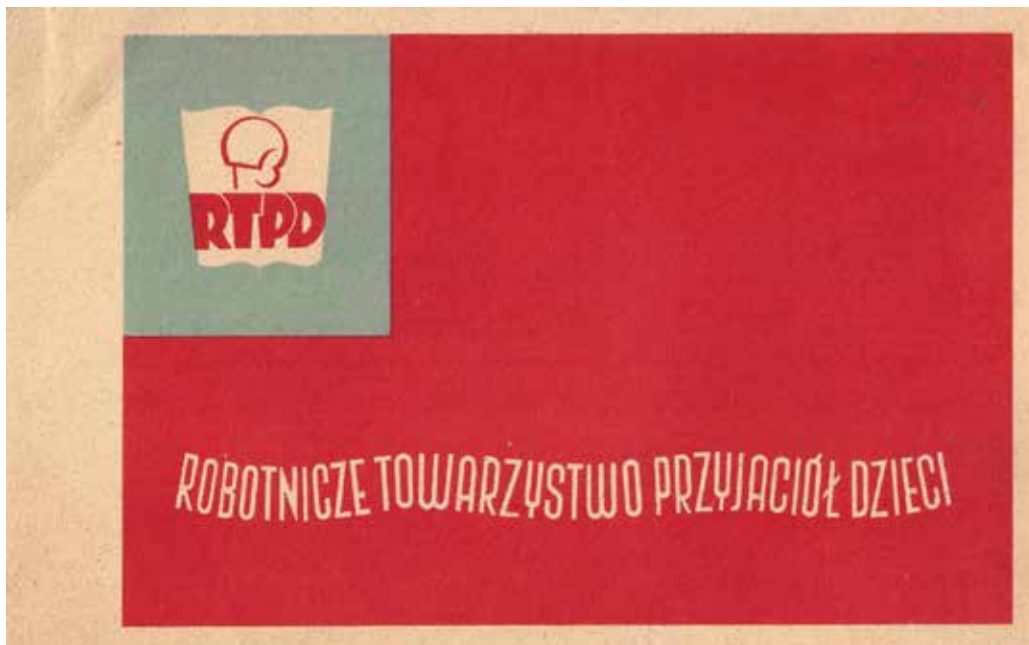
Kat. 16. Papier firmowy Zarządu Głównego RTPD,