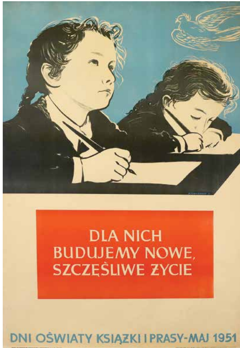
Kat. 12. H. Tomaszewski, Dla nich budujemy nowe szczęśliwe życie