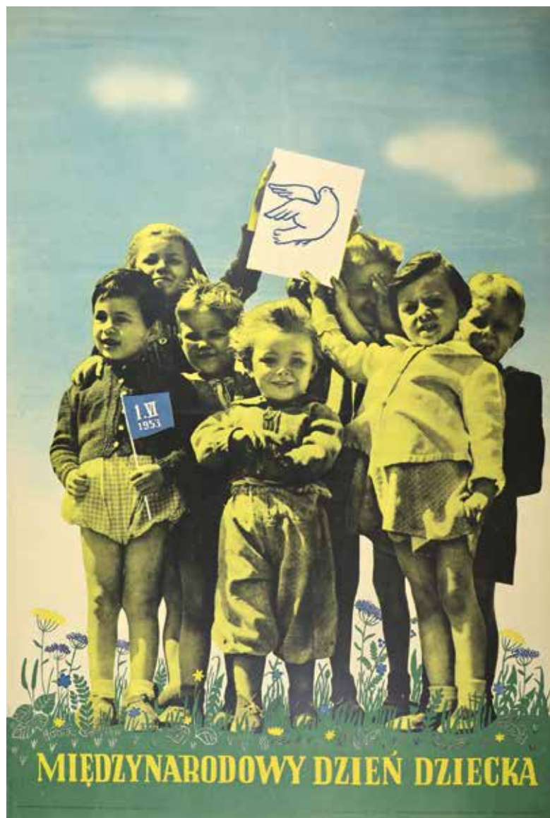
Kat. 23. J. Pirotte, Międzynarodowy Dzień Dziecka