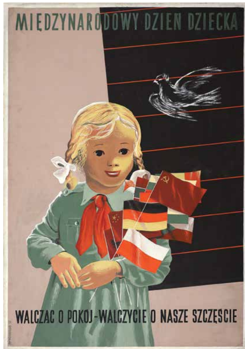
Kat. 22. J. Mroszczak, Międzynarodowy Dzień Dziecka – projekt plakatu