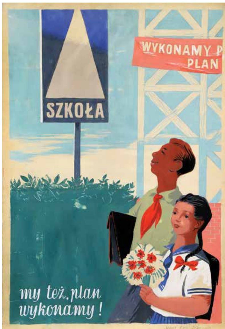
il. 8. Autor nieznan, My też plan wykonamy