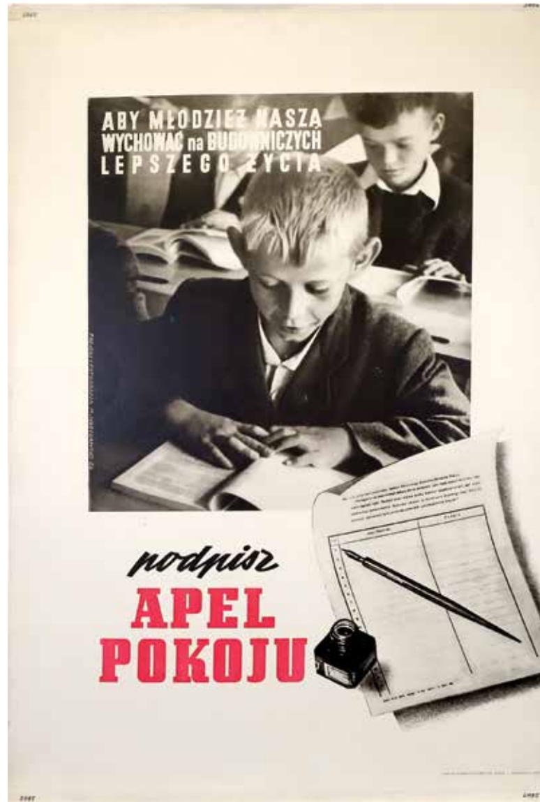
il. 1. M. Wrocławski, Podpisz Apel Pokoju