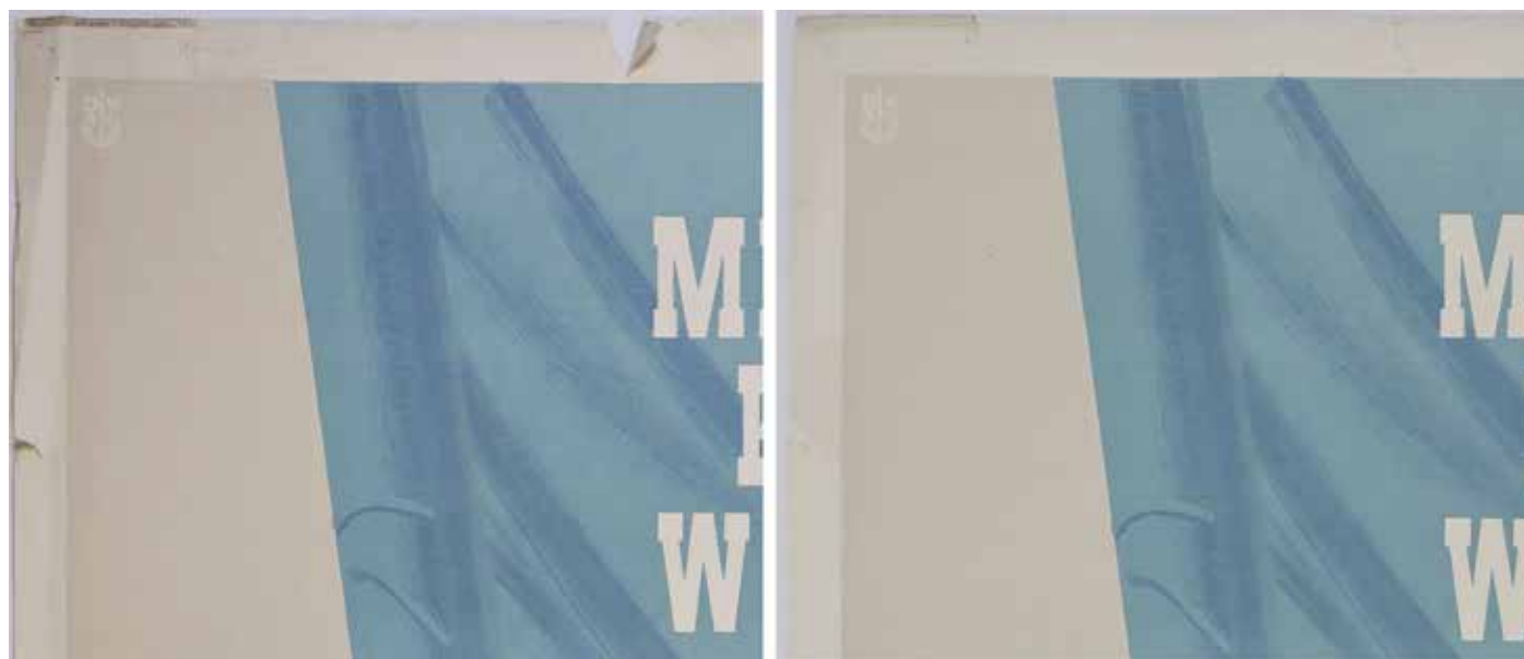
Fragment plakatu nr inw. Pl.707 przed i po konserwacji.

Obiekty z drugiej grupy, zawierającej projekty plakatów wykonane zostały w zupełnie inny sposób i nosiły innego rodzaju uszkodzenia. Jednostkowość tych obiektów, sprawia, że są bardzo cenne. Pozwalają zaobserwować niuanse opowiadające o procesie twórczym i warsztacie poszczególnych artystów, które nie są widoczne na wydrukach. Ponadto, większość z nich, na stronach verso, posiada odręczne zapiski autorów, będące instrukcjami dla drukarni. Na odwrociach występują też pieczętki i podpisy zawierające zgodę na publikację, wydawane przez cenzurę. Muzeum Niepodległości posiada w swych zbiorach ponad 300 projektów plakatów. Znaczna część tych obiektów (również te prezentowane na wystawie) powstała na tekturach oklejonych arkuszami papieru. Artyści do ich wykonania stosowali przede wszystkim farby temperowe dające matową, dosyć grubą warstwę malarską. Miej-