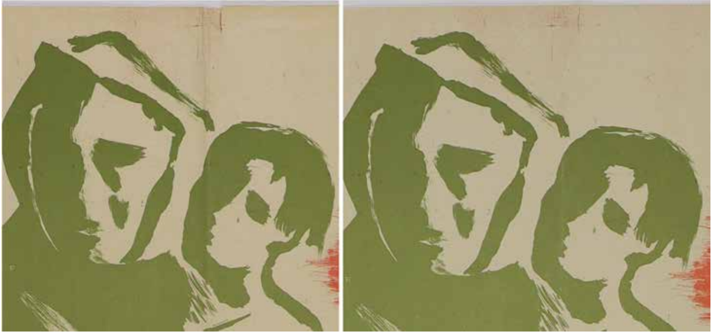
Fragment plakatu nr inw. Pl.2390 przed i po konserwacji.