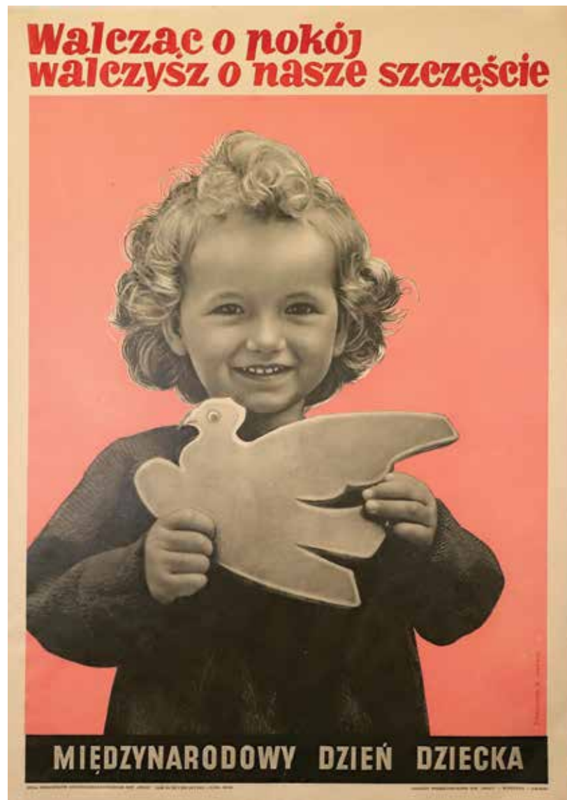
Il. 4. Zbigniew Waszewski, Walcząc o pokój walczysz o nasze szczęście