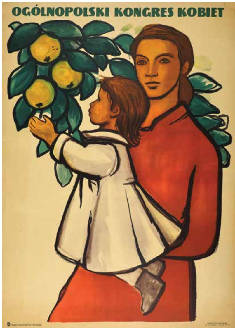
Kat. 25. J. Czerwiński Ogólnopolski Kongres Kobiet