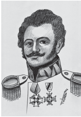
FREDRO Jan Maksymilian