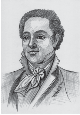
POTOCKI Stanisław Kostka