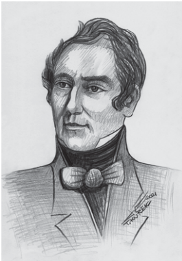
RADZIWIŁ Michał Gedeon