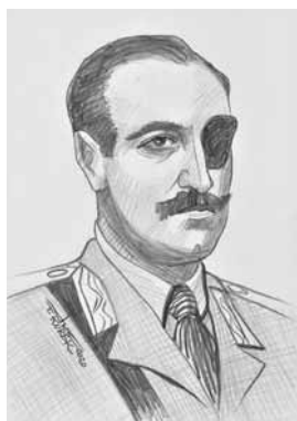
Carton de Wiart Adrian