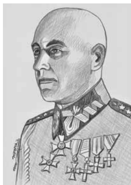
Rydz Śmigły Edward