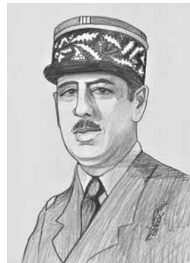
Gaulle Charles de