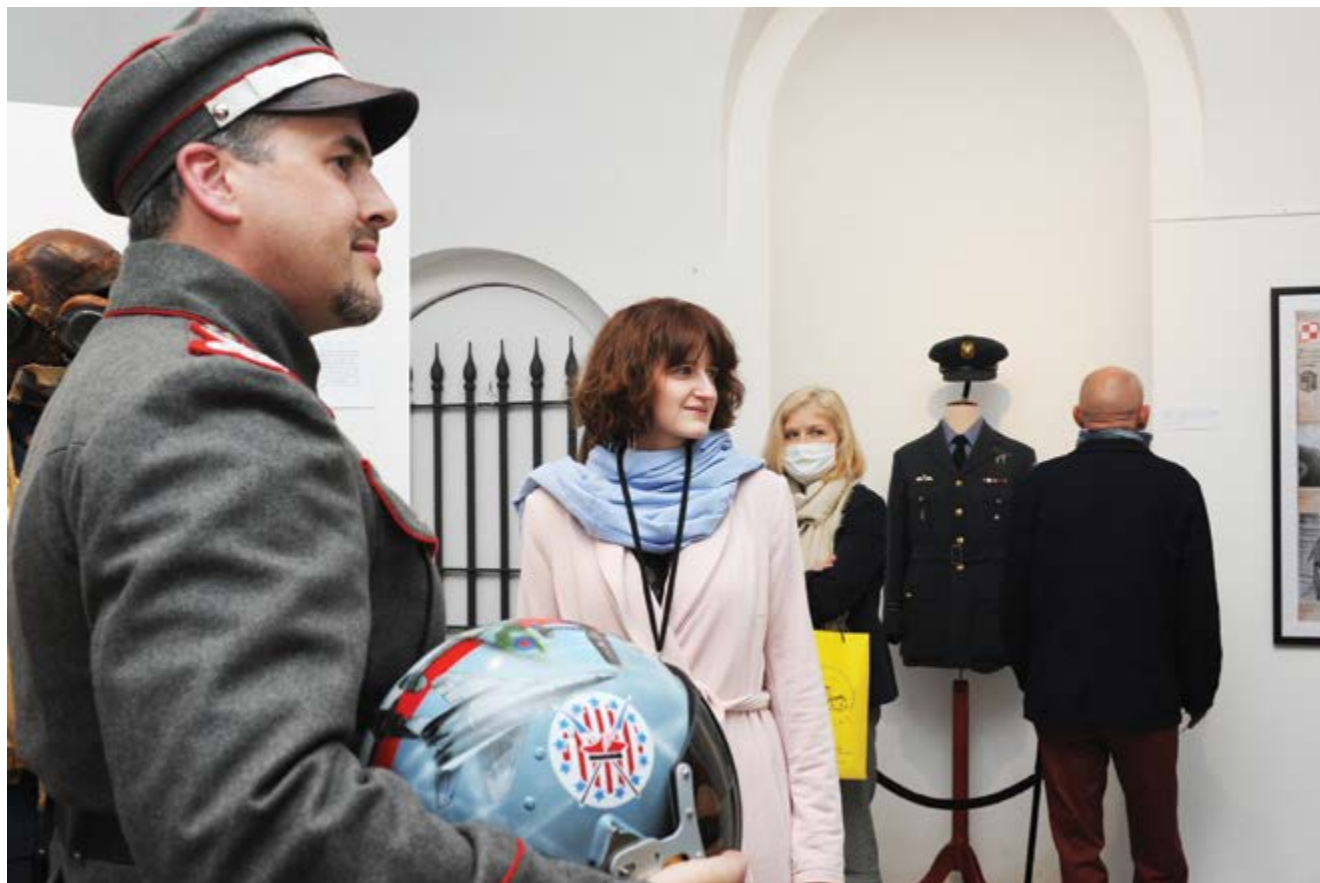
Wernisaż wystawy; (Fot. Tadeusz Stani)