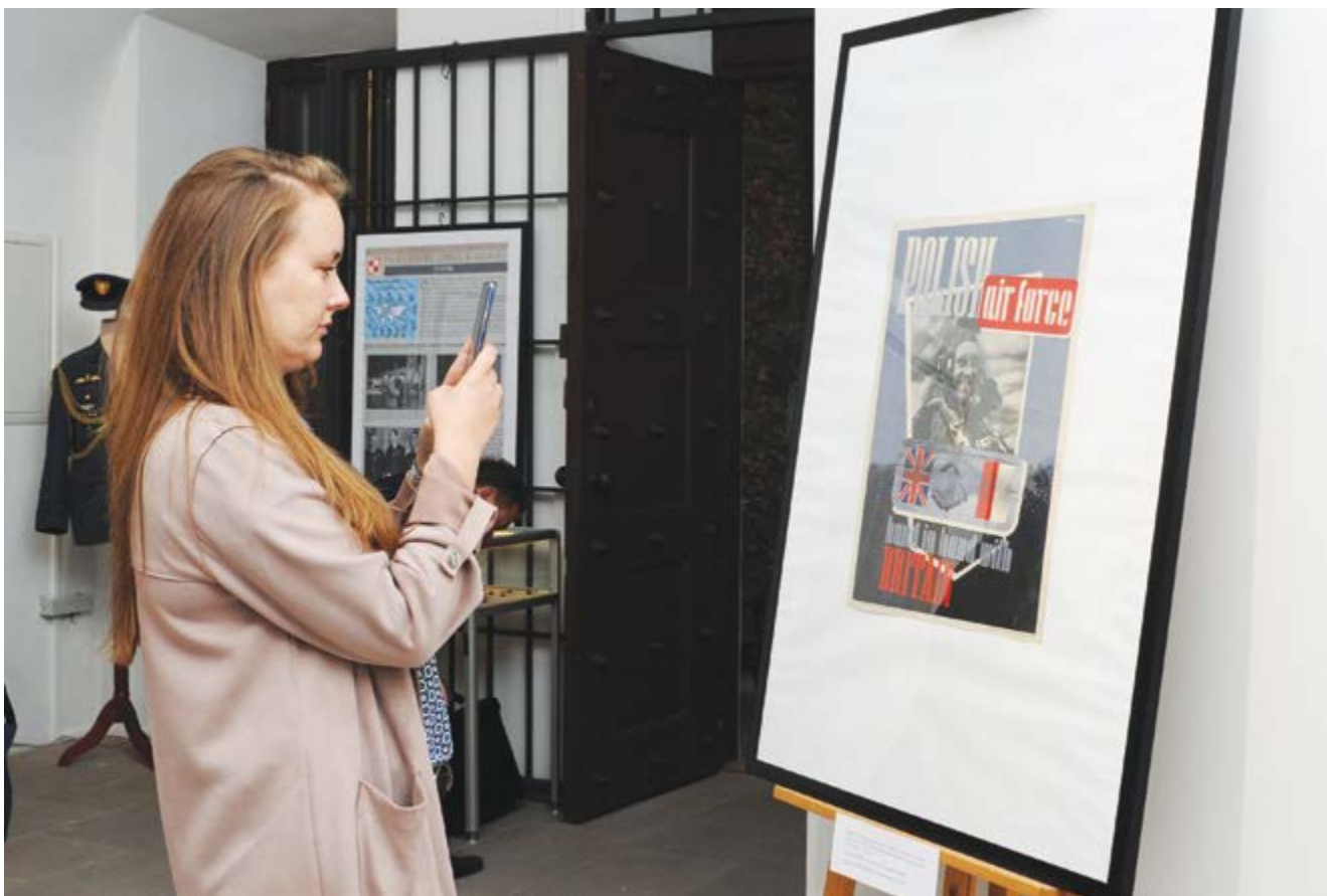
Wernisaż wystawy; (Fot. Tadeusz Stani)