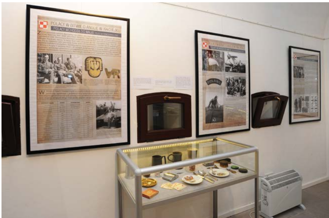
Ekspozycja; (Fot. Tadeusz Stani)