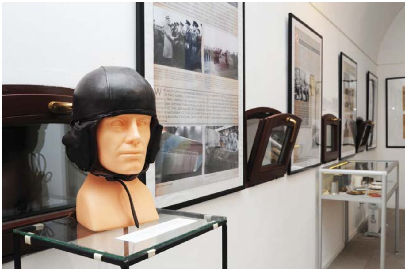
Ekspozycja; (Fot. Tadeusz Stani)