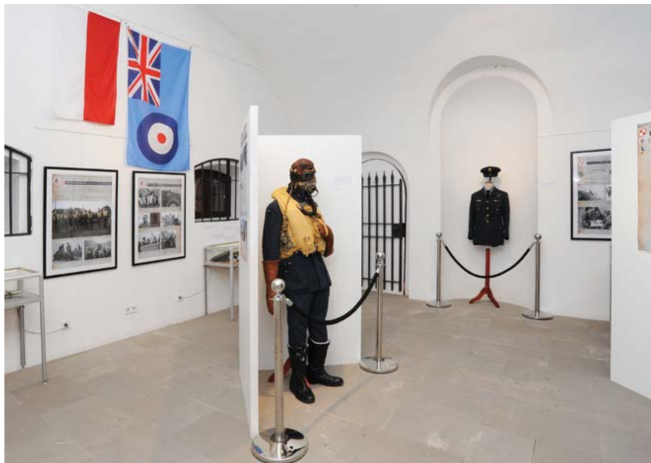
Ekspozycja; (Fot. Tadeusz Stani)