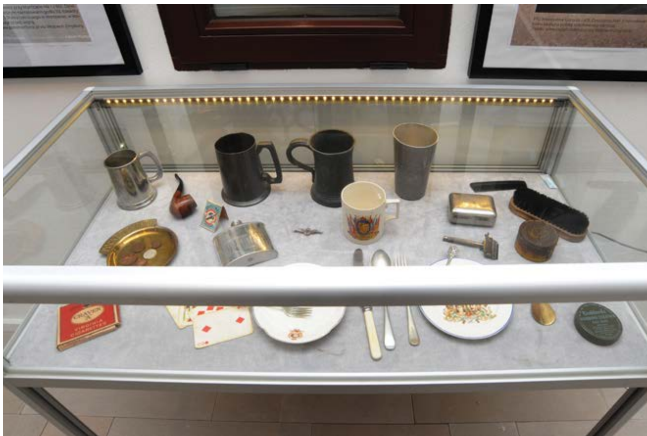
Ekspozycja; (Fot. Tadeusz Stani)