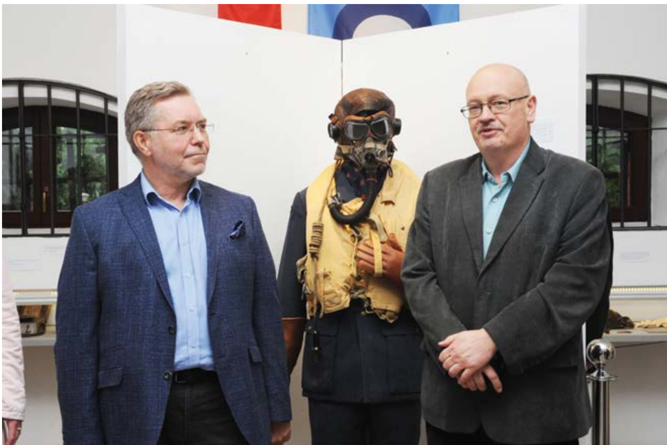
Wernisaż wystawy; (Fot. Tadeusz Stani)