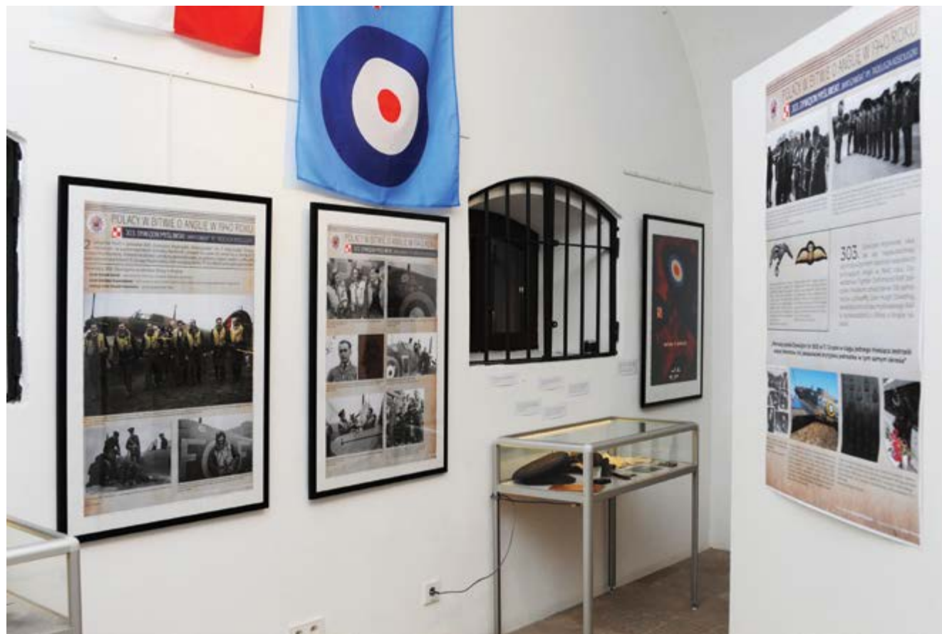
Ekspozycja; (Fot. Tadeusz Stani)