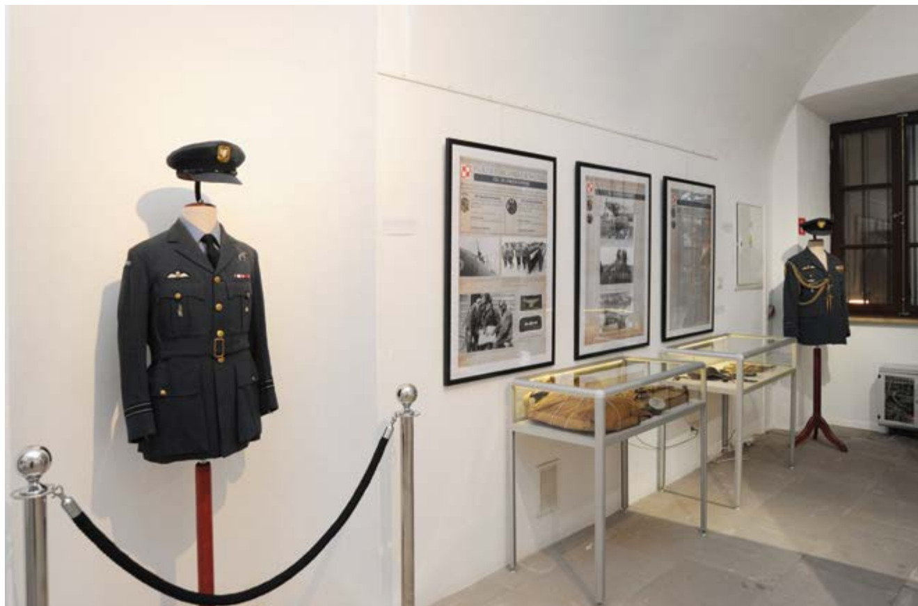
Ekspozycja; (Fot. Tadeusz Stani)