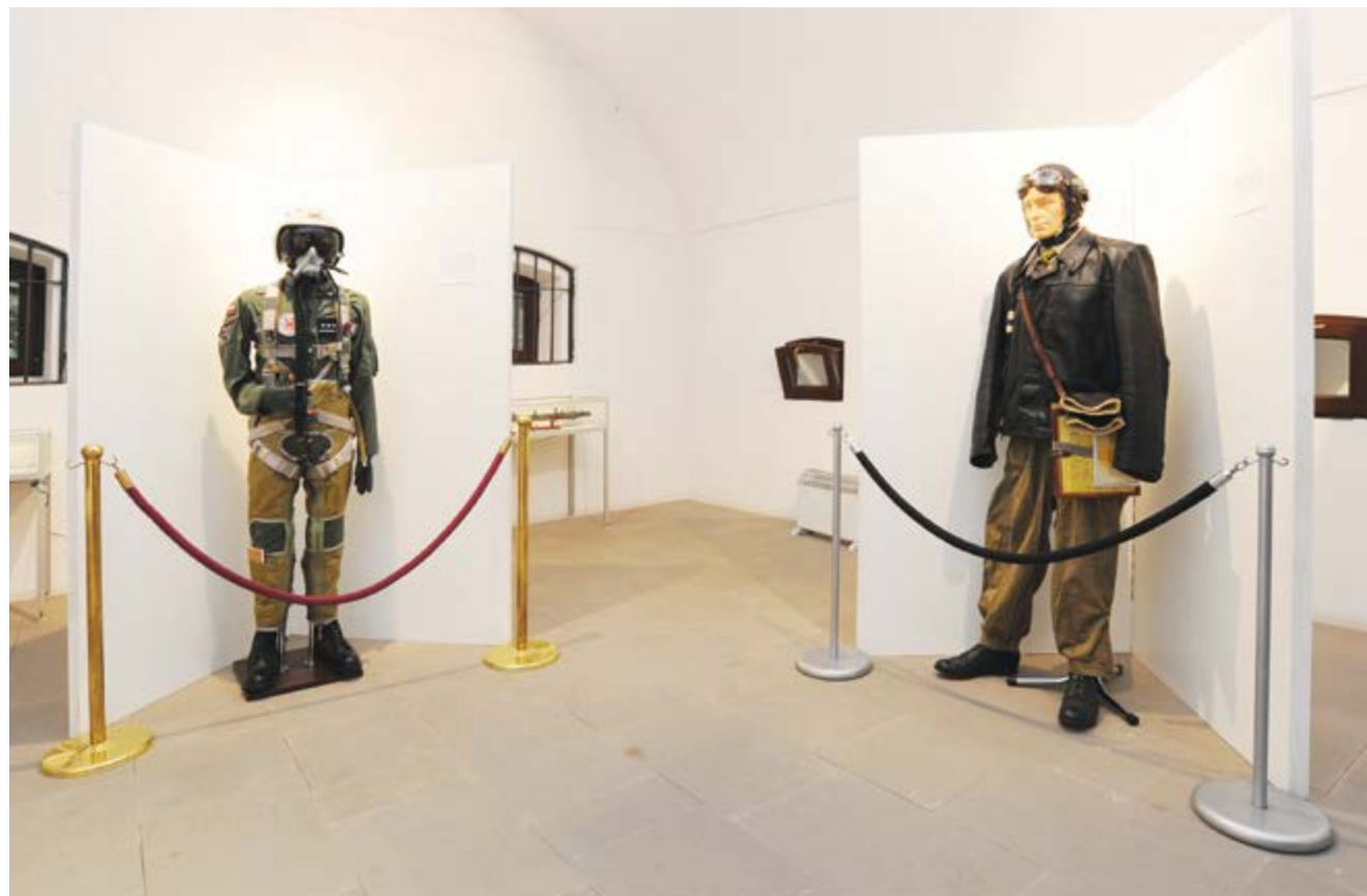
Ekspozycja; (Fot. Tadeusz Stani)